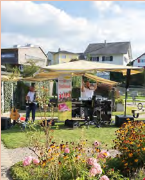
Konzert der Partyhelden im September 2020

Leider sind im 2020 aufgrund Corona mehrheitlich alle Anlässe abgesagt worden. Einige Konzerte konnten bei wunderschönem Wetter im Garten stattfinden. Sie wurden von den Bewohnenden sehr geschätzt und bereiteten viel Freude.